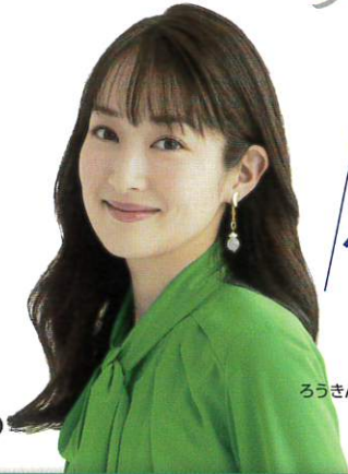
ろうきんアンバサダー 高梨 臨

住宅資金(新築・購入・借換等)に、 「現在ご利用中の各種ローンのお借換え資金」や 「自動車・教育等の新たな資金・ 家具家電購入資金」を、 最高500万円までプラスできます。